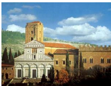
SAN MINIATO AL MONTE

La Chiesa di Santa Maria Novella era il centro dell'ordine domenicano a Firenze. La chiesa conserva uno stile romanico all'esterno con i marmi bianchi e verdi con disegni geometrici ed uno stile gotico al suo interno. La sua costruzione fu iniziata nel 1246 e completata nella prima metà del 1300 da Jacopo Talenti: la bellissima facciata fu ripresa nella metà del XV secolo da Leon Battista Alberti. All'interno, nella sacrestia, è possibile ammirare la croce dipinta da Giotto per il convento.