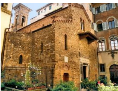
SANTI APOSTOLI E BIAGIO