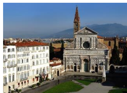
SANTA MARIA NOVELLA